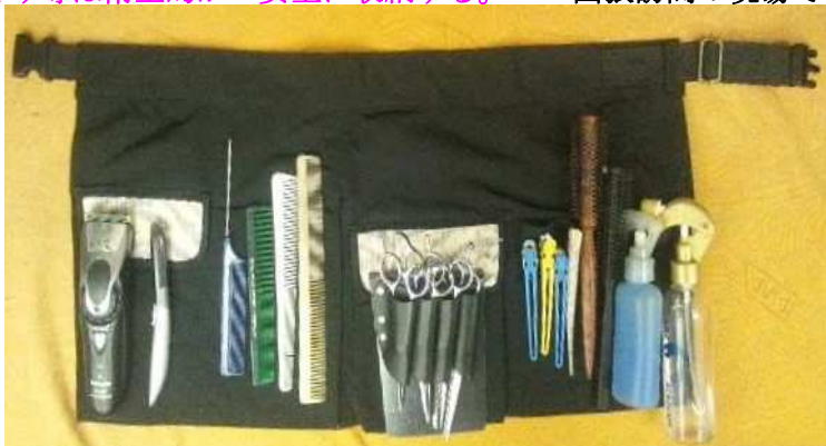
バリカン シェバー ハサミ類は蓋付きポシェットへ

はさみ等は衛生的かつ安全に収納する。〜〜出張訪問の現場で体験した危険性を回避するウエストポーチ