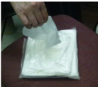
ペーパータオル15枚をビニール袋で保護

皮膚に接する器具・タオルは客1人毎に清潔なものを使用する。〜〜使い回しを避け、清潔・安心第一