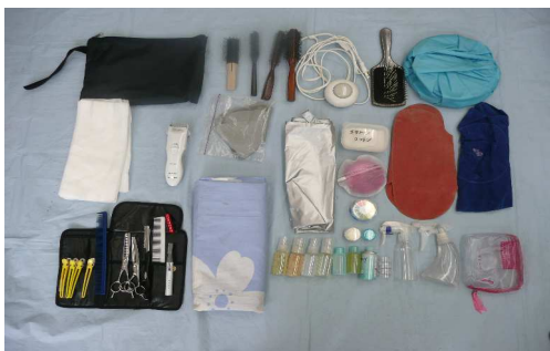
収納バック・ブラシ類・フットスイッチ・平形ブラシ ペーパータオル・バリカン・ネックシャッター・クロス パフ・エアークッション・使用済み刃物類収納ケース 床用シートの畳んだ状態・薬液・水物・スプレイナー