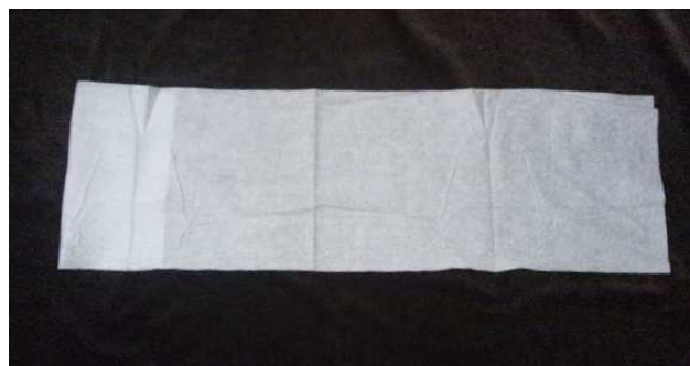
一枚ずつ引き出して使用します。20cm×75cm

上記内容・フォトについてのご質問はいつでもご連絡(メール・電話)下さればご説明させていただきます。