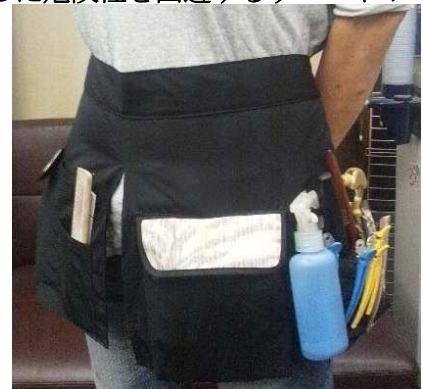
外からハサミ類は見えません

皮膚に接する器具・タオルは客1人毎に清潔なものを使用する。〜〜使い回しを避け、清潔・安心第一