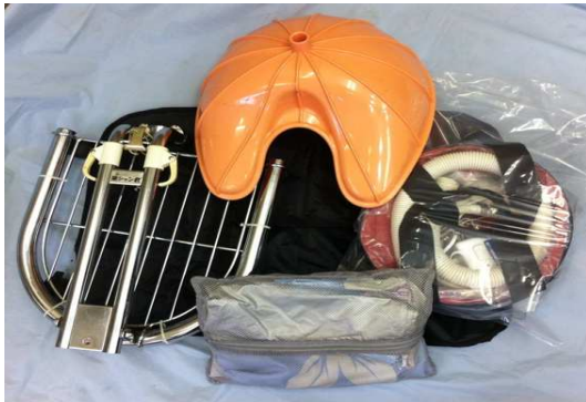
携帯用洗髪台「ニュー楽シャン君」本体重量 7.5Kg 3~5分で組み立て お湯と電源があればどこでも使用可

洗髪 の設備もあれば尚可 。〜〜〜団塊世代の高齢化を予測して16年前より準備し、8年前より販売 ビニール材などのシートの上で作業を行う