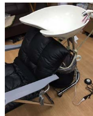
ホワイト・ブラックボールあります