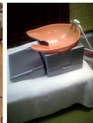
ベッド使用の補助用具は別注