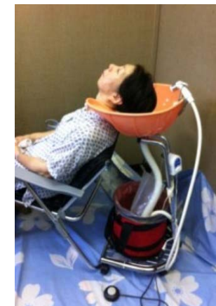
ベストポジション座位状態