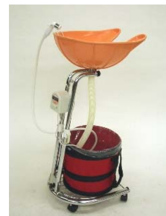
ニュー楽シャン君組み立て完了