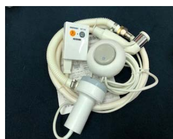
裏側にキャスター付き