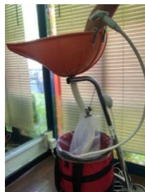
スタンドパイプの弾性により前へ沈みます