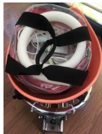
横 40cm 縦 40cm