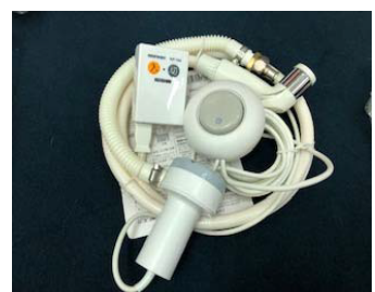
業界一軽いシャワーセット 560g