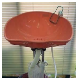
首が収まる U 字部位