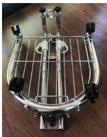
裏側にキャスター付き